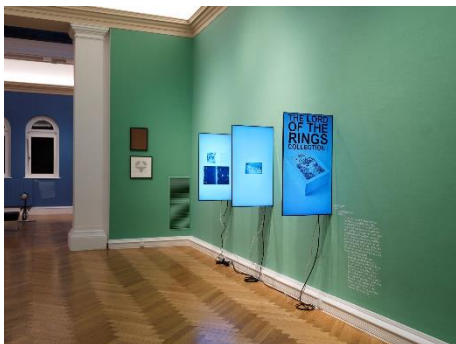
Ausstellungsansicht_PROOF OF ART_3.jpg Ausstellungsansicht „PROOF OF ART. Eine kurze Geschichte der NFTs, von den Anfängen der digitalen Kunst bis zum Metaverse“, 11.06. – 15.09.21, Francisco Carolinum Linz