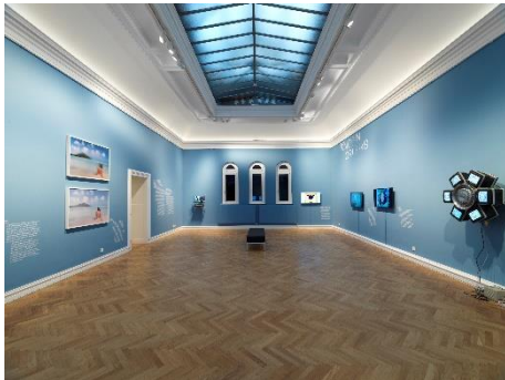
Ausstellungsansicht_PROOF OF ART_2.jpg Ausstellungsansicht „PROOF OF ART. Eine kurze Geschichte der NFTs, von den Anfängen der digitalen Kunst bis zum Metaverse“, 11.06. – 15.09.21, Francisco Carolinum Linz