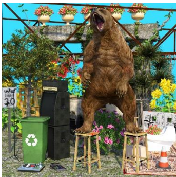
Mark Sabb_Bear Land.jpg Mark Sabb (Felt Zine), „Bear Land“, 3D Image (jpg), 2019