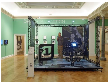
Ausstellungsansicht_PROOF OF ART_4.jpg Ausstellungsansicht „PROOF OF ART. Eine kurze Geschichte der NFTs, von den Anfängen der digitalen Kunst bis zum Metaverse“, 11.06. – 15.09.21, Francisco Carolinum Linz