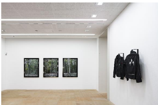
terra0_morphology panel_ workwear jacket.jpg „terra0 morphology panel 01-03“ and „terra0 workwear jacket“ in „Survival of the Fittest“ at Kunstpalais Erlangen