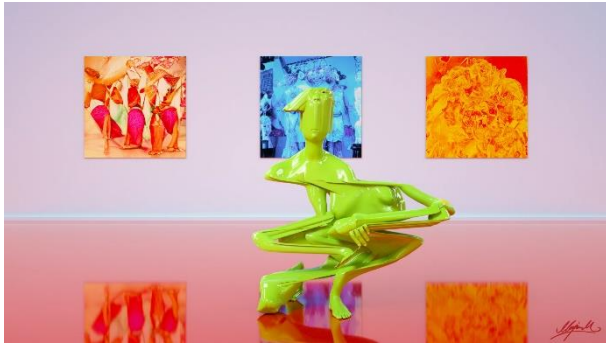
Marjan Moghaddam_Taking the Knee In Solidarity with GAN Paintings.jpg Marjan Moghaddam, Still from „Taking the Knee In Solidarity with GAN Paintings“, 3D CG Animation of Chronometric Sculpture, GAN, Stereo Music, Sound Design, 2020

Die Pressebilder stehen auf www.oekultur.at zum Download bereit. Lizenzfreie Nutzung nur unter Angabe des Bildrechts und nur im Rahmen der aktuellen Berichterstattung erlaubt.