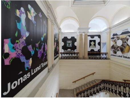
Ausstellungsansicht_PROOF OF ART_1.jpg Ausstellungsansicht „PROOF OF ART. Eine kurze Geschichte der NFTs, von den Anfängen der digitalen Kunst bis zum Metaverse“, 11.06. – 15.09.21, Francisco Carolinum Linz